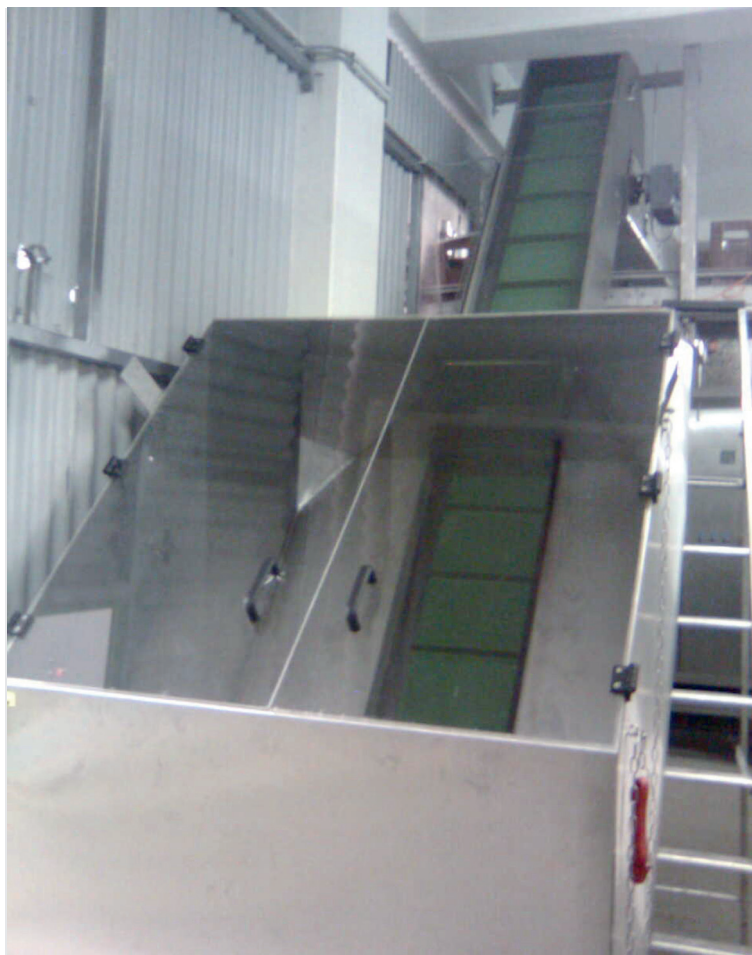
Конвейер на заводе Campina, Германия

Компания NATE-nápojová technika a.s. поставила на завод в Кёльне в общей сложности четыре установки. Первая установка была поставлена в 2008 году. Это был подборщик этикеток.