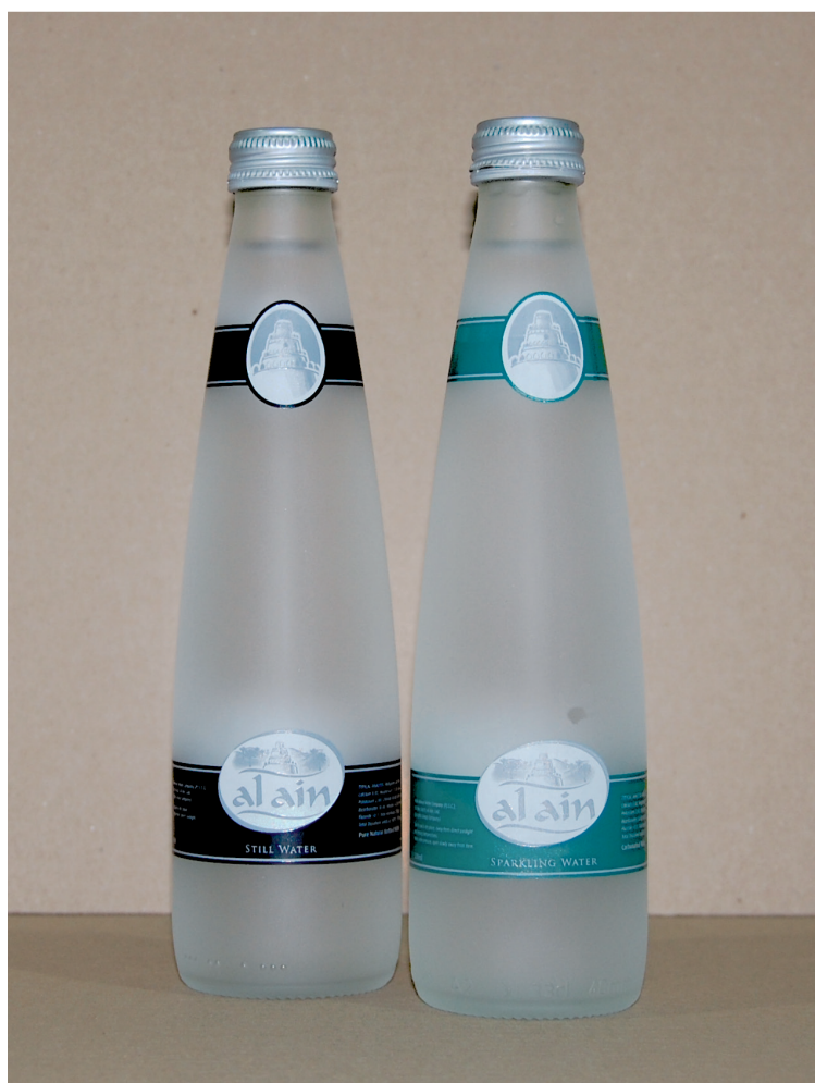
Матовые бутылки компании Al Ain

До недавнего времени компания Al Ain Mineral Water разливала только негазированную воду в ПЭТ-бутылки. В ответ на запросы рынка возник новый проект розлива газированной и негазированной воды в стеклянные бутылки 330 мл и 1000 мл. Используются прозрачные и матовые бутылки: прозрачные предназначены для брендовых отелей, матовые – специально для правительства эмирата Абу-Даби.