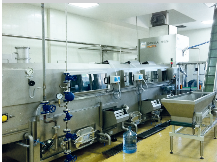
Моечная машина и машина розлива в 19-литровые бочки на заводе „Оболонь”, Украина