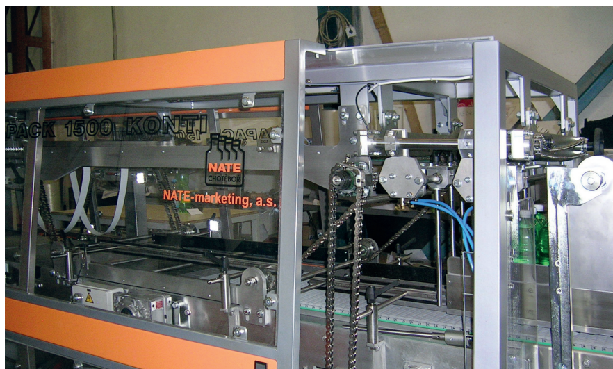
Непрерывная упаковочная линия NAPACK 1500 в цеху Domgo Borgazdaság, Венгерская Республика

Преимущества: возможность упаковки продукции в плёнку с печатным рисунком