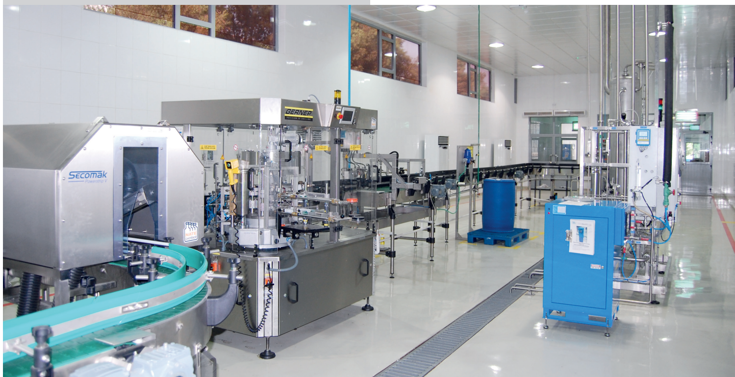
Линия для упаковки в стеклянную тару на заводе Al Ain