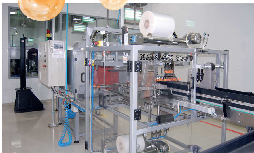
Автоматическая упаковочная линия NAPACK 500 в цеху Al Ain, SAE