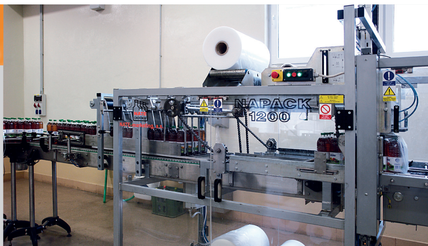
Полуавтоматическая упаковочная линия в цеху Ostrána Vzenec, Чешская Республика

Преимущества: выгодное соотношение между ценой и качеством машины