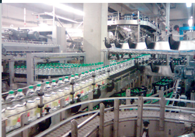
Конвейерная система на заводе HAANER FELSENQUELLE, Германия